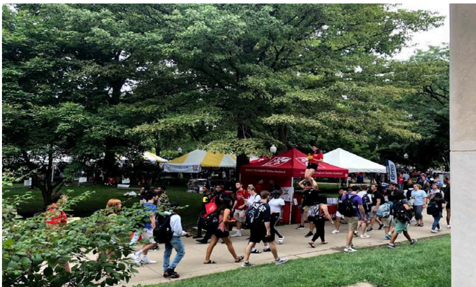
圖為社團博覽會中馬戲團社的表演

相信對於出國交換有興趣的人都會樂於與來自世界各地的人交流，而這也是我在交換生涯中寶貴的一部份，雖然離別從來都不容易，不知道什麼時候可以再回到同個地方，見到同個人的苦澀都是必經，但那些一期一會的相遇卻又是如此難能可貴，在外地生活互相扶持的情感是一輩子都會惦記著的。ISU 有許多學生社團，通常於剛開學時會有社團博覽會讓各社團設攤介紹自己，不管是動、靜態、學術、志工、兄弟姐妹會等等你所想像的到的社團都有，甚至還有馬戲團社，就算沒有參與也不要錯過他們每年的表演！學校也會提供申請語言同伴的機會，與當地學生配對，可以藉此融入、認識美國文化，諸如參加派對等等的活動。