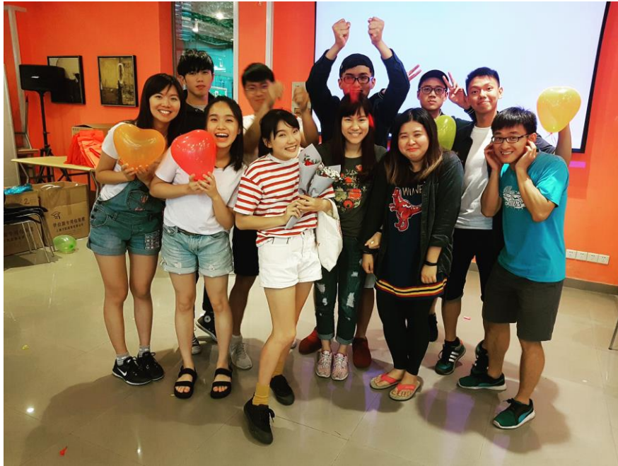
這趟交換真的是太值得了！一個學期從來沒有過的這麼快！