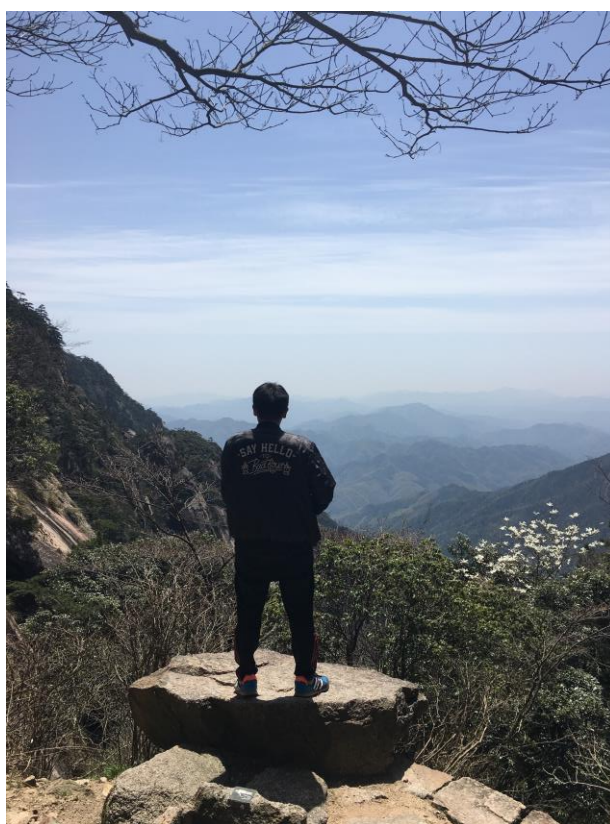
在上海依然要打籃球