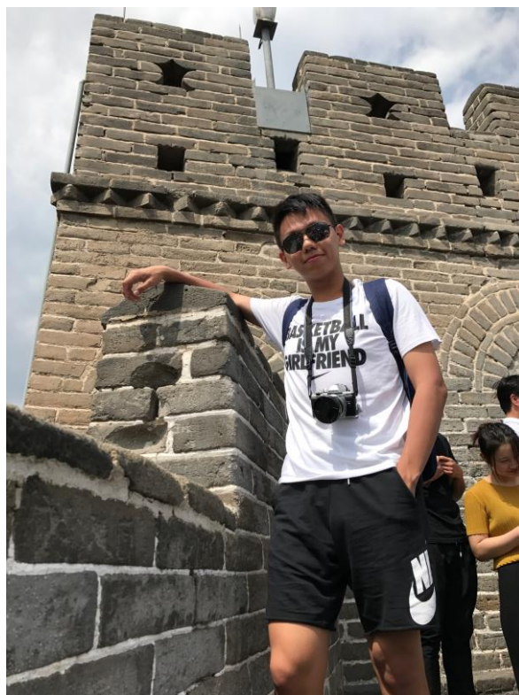
五嶽歸來不看山，黃山歸來不看岳