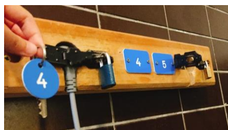
和洗衣機插頭配對的鑰匙。

洗衣方面，一次 16 元新台幣，以證件和櫃檯拿鑰匙，不用用洗衣籃佔位子排隊。每台洗衣機有編號，拿鑰匙可以解鎖洗衣機插頭，蠻佩服校方想出來的管理方法！