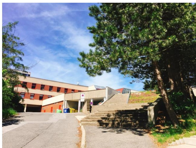
↑通往宿舍區的階梯。 底下為垃圾場。