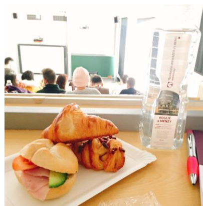
新生說明會。 可頌和楓糖麵包超好吃。

除了上述比較正式的活動以外， ESN 不定期也會舉辦戶外小活動，例如打保齡球、溜冰、參觀 Ještěd 、布拉格三天兩夜.....等，有興趣的同學都可以自行跟一波。