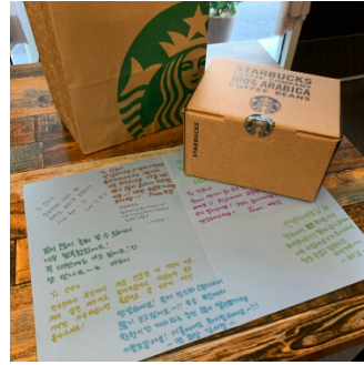
我離開前幾天收到韓國朋友做給我的蛋糕真的好感動，在釜山的這學期受到很多人的幫助，大家都對我好好，過得很幸福的 2019 下半年。