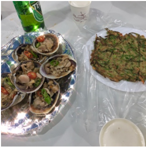
在釜山留了美好回憶的部分照片