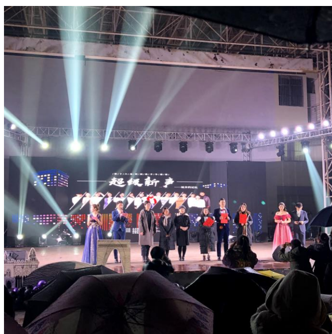
圖三：超級新聲決賽現場

社團的部分華中師大並沒有像台灣的風氣這麼盛行，也不會像台灣有什麼系(院)學會固定辦活動給學弟妹們參加，但還是會有一些零星的小活動、聚會，不一定要入社才能參加，基本上他們都會蠻歡迎大家去體驗的，如果有興趣可以關注一下各社團資訊。操場及旁邊的露天廣場是校內社團辦活動的地方，我剛好遇上學生會舉辦一年一度的大活動，是校園歌手比賽「超級新聲」，這活動讓我非常震撼，看得出來主辦單位非常用心，還為每一位選手拍宣傳照、錄各種宣傳影片，各個細節都不馬虎，還以為在電視上的選秀節目現場！除了這種大型活動外，我有時會去語言教學交流、排球、面具體驗、聖誕趴…等等社團，原本還想參加滑板社的，但因為社團的時間對不上所以作罷，心裡還是有些惋惜。