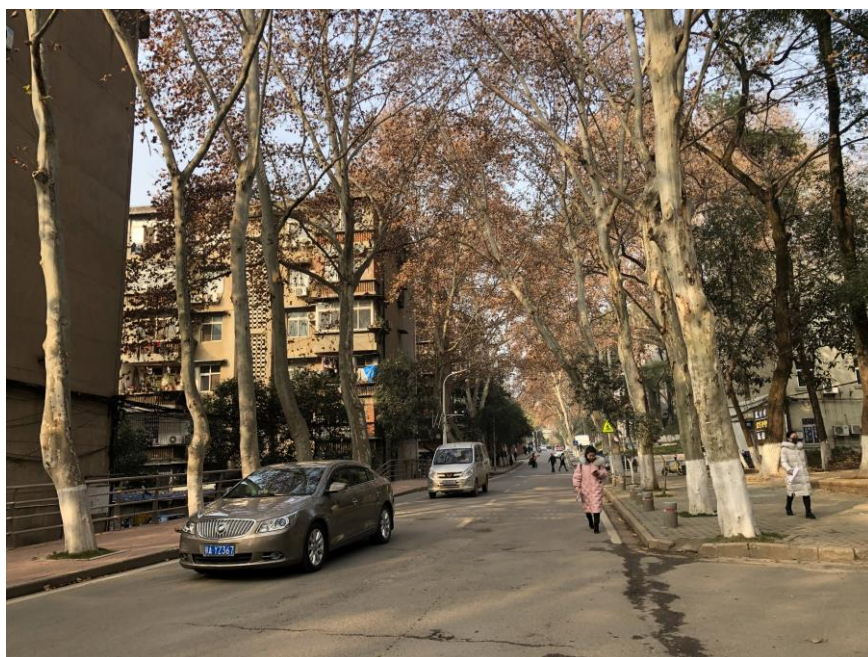
圖十：每天回宿舍的必經之路

還有好多好多…當時是抱著這樣的心情離開的，這四個月豐富了我的大學生活，從一開始的不安到最後滿載而歸，不管回憶是甜是苦，希望我能捕捉到在這裡的每一個當下，深深地刻記在腦海中。很慶幸當初自己的選擇，謝謝家人、北市大、華中師大給我機會，短短四個月雖然占據我大學生活的時間不多，但這段得來不易的回憶令人相當難忘，希望未來還有機會踏上華中師大的土地。