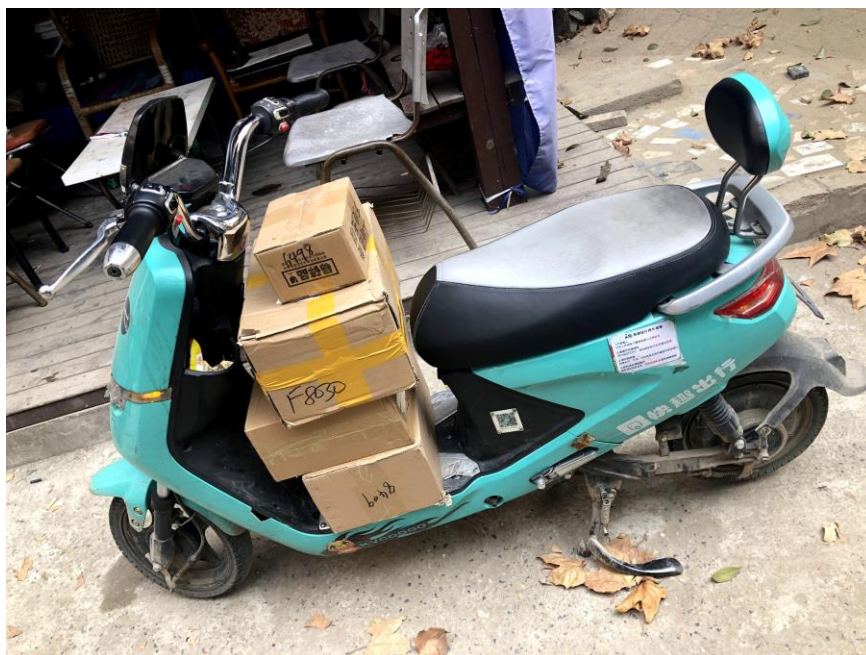
圖七：快趣出行電動車