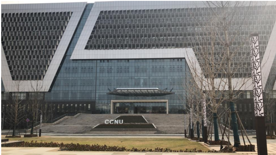
圖二：華中師大南湖校區正門口