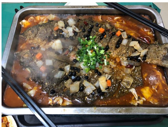
圖五：東二食堂一樓新食尚烤魚