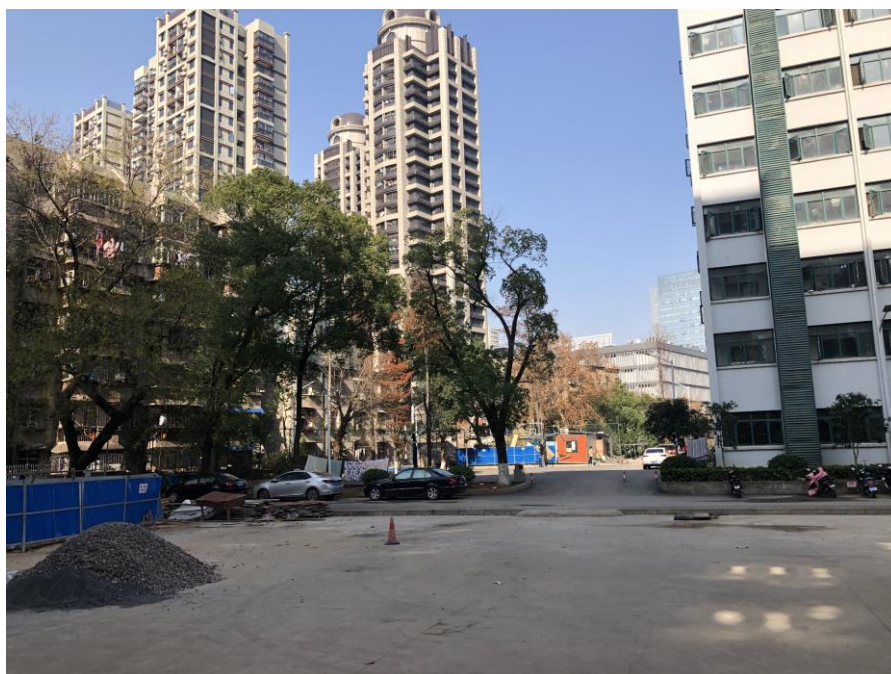
圖六：國交五棟外空地(施工中)

識，留學生還常常會辦生日趴，會一塊到某個同學的房間裡吃飯、聊天、跳舞，還蠻有趣的！國交五棟前面有一塊空地，天氣不冷的時候，晚上會聚集很多人坐在旁邊聊天、打球，有籃球、排球、足球、羽毛球…等，如果晚上想活動一下筋骨可以來這邊碰碰運氣哦！