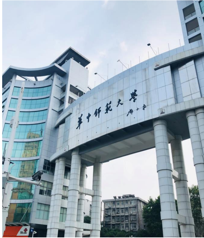
圖一：華中師大北門外觀