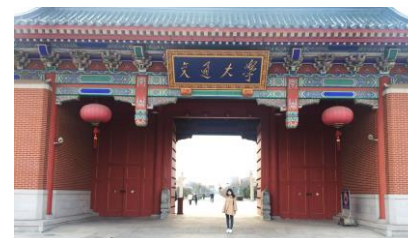
上海交通大學廟門

躍身國際金融都市之位的上海，共伴著我們的學習生活，有著租界畫地的異國風味、也濡染著古典中國的氣派，從華東師範大學走出，我們正力行著俗話的一句：「讀萬卷書，行萬里路。」，成長。