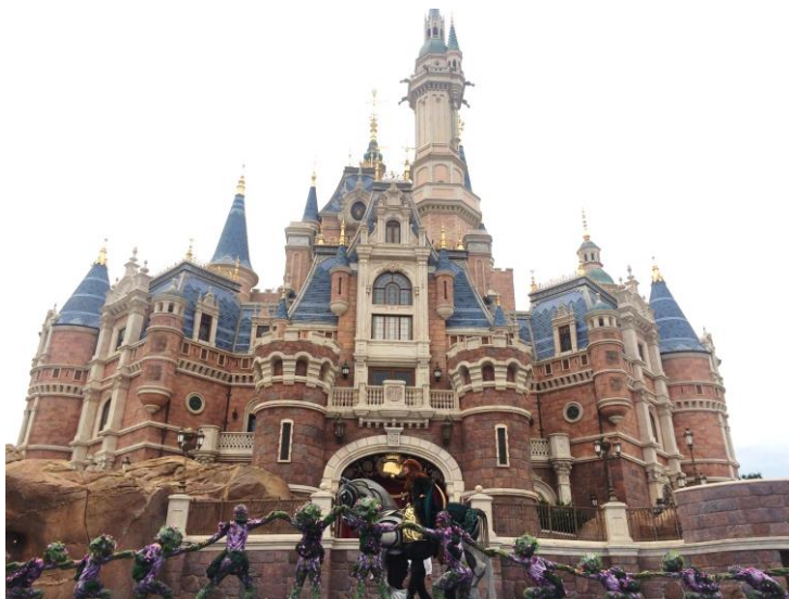
上海迪士尼主題樂園