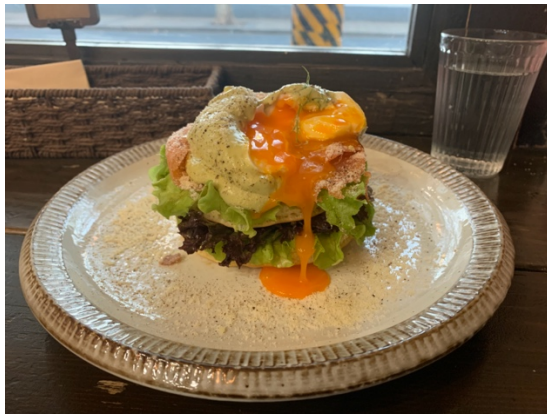
讓我瘋狂的煙燻鮭魚水波蛋鬆餅，真的超級好吃的。60RMB...