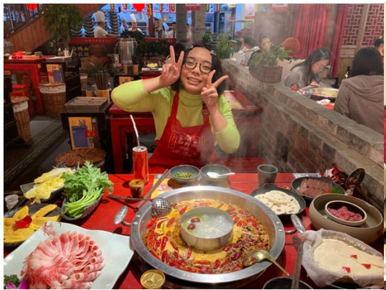
鴛鴦鍋都很好吃！大眾點評折扣多！讚！