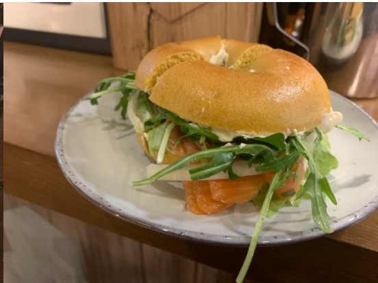
有名的貝果店的煙燻鮭魚南瓜貝果，很好吃！！貝果真的有南瓜味！！