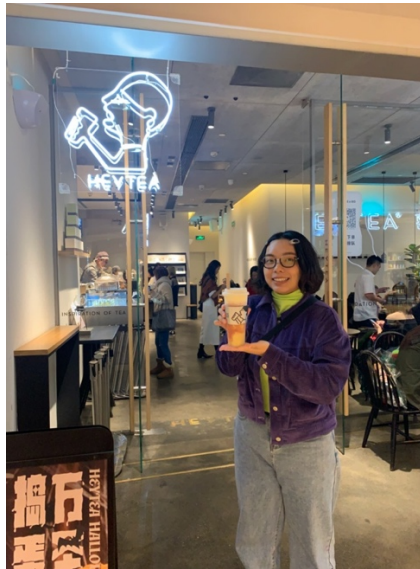
左邊是我的愛喜茶，真的各方面都很好，很多期間限定商品，中國飲料走很高級複雜的路線，唯一缺點就是真得不是普通的貴，隨便都 20-30RMB 呢。右邊是跟喜茶 PK 的樂樂茶，但我覺得飲料不怎樣，蛋糕不錯。