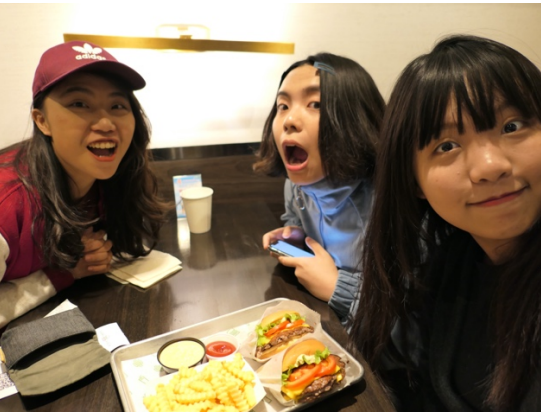
台灣還沒有的有名漢堡，出來交朋友很重要，千萬注意。