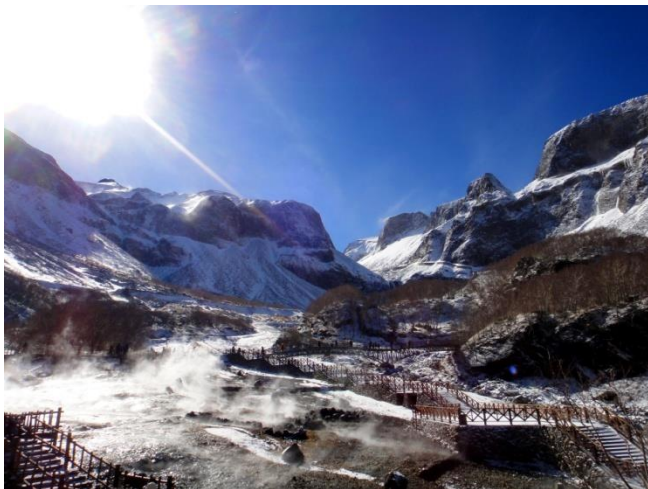
東北長白山的雪景