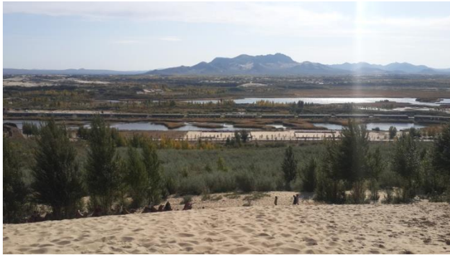
內蒙古的玉龍沙湖