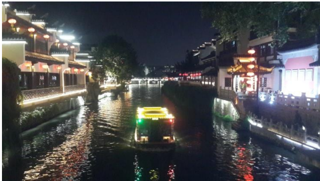
南京秦淮河的夜景