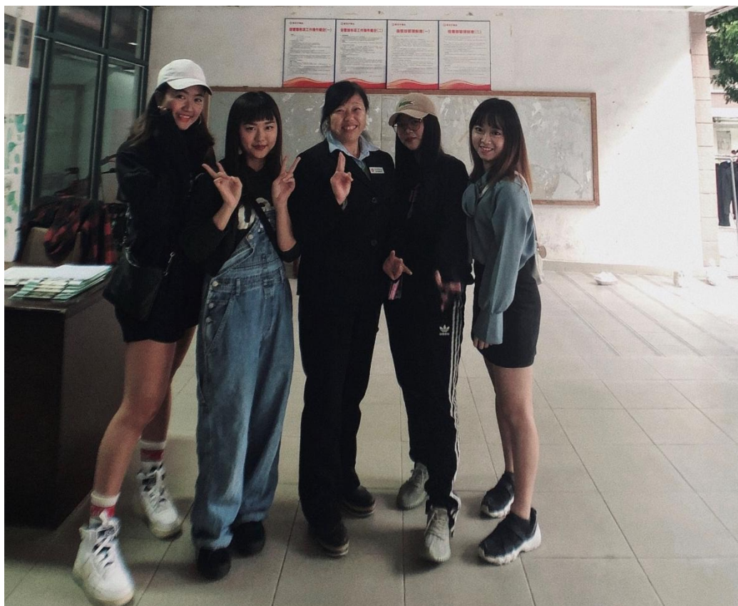
室友與宿管阿姨(左三)

大學城校區內只有我四個台灣女孩，剛好我們都在同一個學院，想家的時候還有熟悉的台灣口音，是件非常幸福的事！