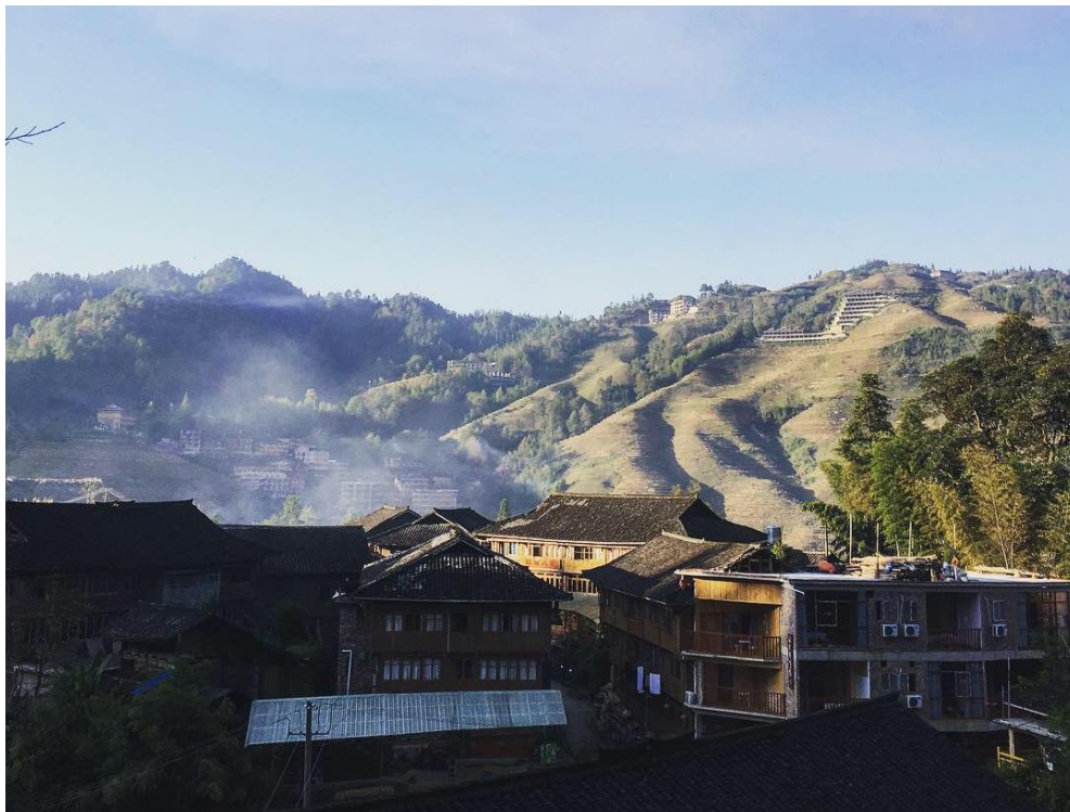
廣西美景-房子為當地傳統的吊腳樓