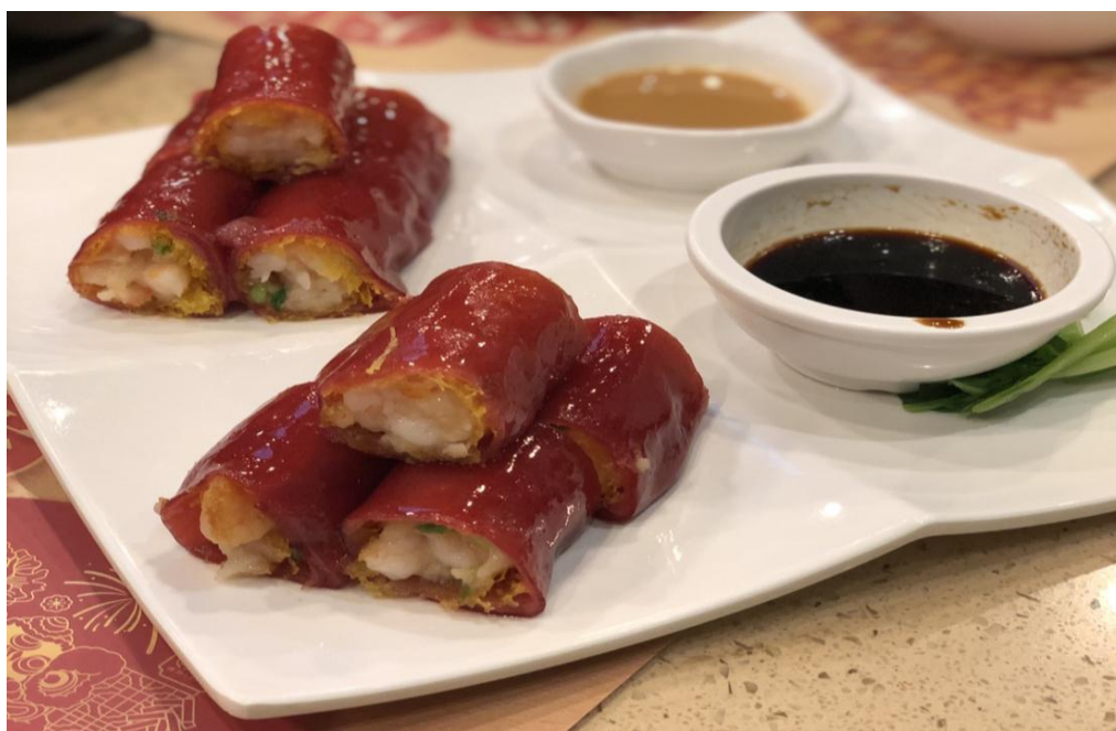
廣州最有名的茶樓「點都德」的招牌菜-金沙紅米腸

大學城校區內只有我四個台灣女孩，剛好我們都在同一個學院，想家的時候還有熟悉的台灣口音，是件非常幸福的事！