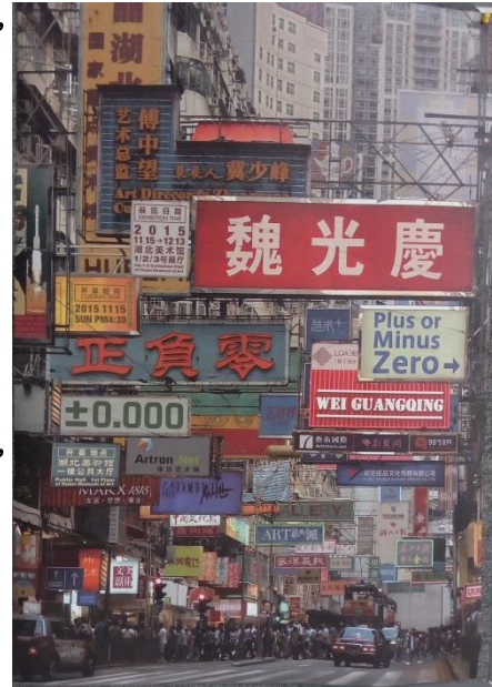
圖八，右圖， 《正負零》 海報。