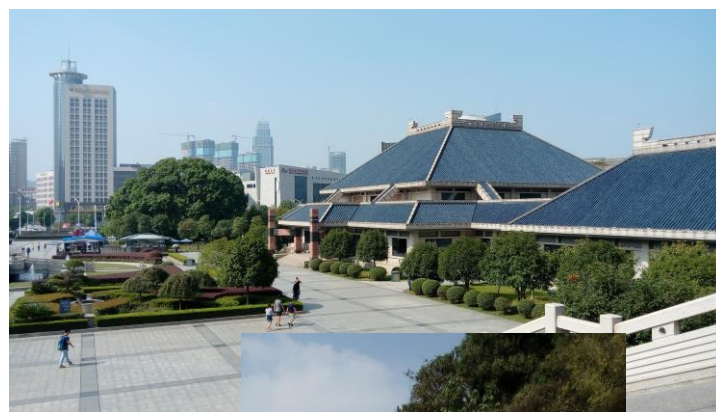
圖四，左圖，湖北省博物館。

之後，港澳台辦還帶著我們去了赤壁，大家都知道三國演義中的故事，有百分之八十以上的場景都是在湖北。所以難得有機會可以看到歷史故事中的場景，讓我非常的興奮，雖然和當時的各種情況都不一樣，但還是會有一種莫名的感慨，似乎那些歷史名人也曾經像我這樣站在這裡，然後凝望著遠方，光是想像就有一種難以名狀的心情。