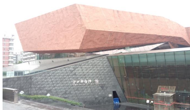
圖三，上圖，辛亥革命博物館。