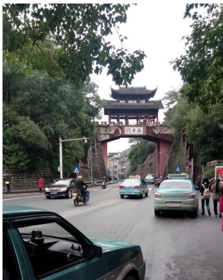
圖十，下圖，鳳凰古城景色。