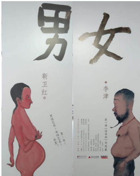
圖七，左圖， 《男，女》 海報。