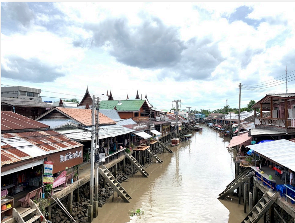
(圖：位於夜功府的 Amphawa 水上市場)

泰國有 77 個府，各個府有各種不同的特色，美食也因地區而有所不同，在交換的這段期間去了不少府，像是坤敬府、烏汶府、沙繳府等等，我特別喜歡泰國的大自然景觀或是廟宇的華美建築，怎麼拍照都還是一樣漂亮。