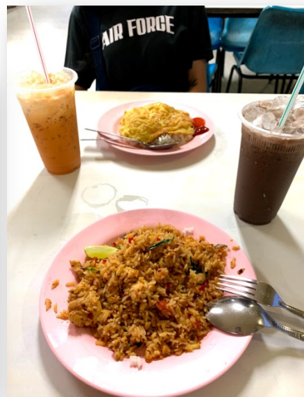
(圖左：打拋牛飯 圖右：煎蛋配飯和酸辣炒飯)