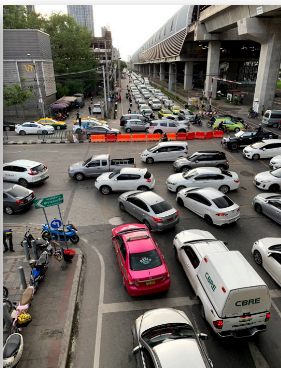
(圖左：機場快線 Lat Krabang 站 圖右：曼谷塞車日常)