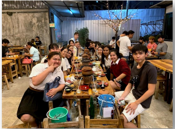
(圖左：使用英語上課 圖右：與同學們去吃燒烤吃到飽)