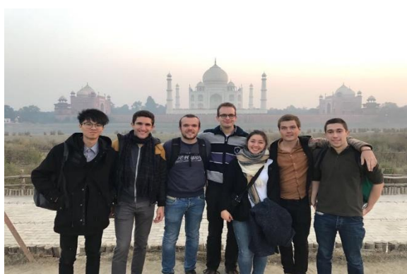
(圖三：與國際學生們在 Taj Mahal)

在這一學期，IIT Delhi 大約有 20 位的國際學生！亞洲部分臺灣、南韓及香港各一名，中國大陸學生(只有來短短一個月)兩名，其餘的學生皆來自於歐洲國家，而在這群交換學生中，就屬我年紀最小，只有 20 歲。其他的學生年紀普遍介於 23 至 26 歲！雖然我的年紀差距有些甚大，但卻不會對日常的相處上造成任何的隔閡。大家總是一起吃飯一起出遊，並對彼此所屬的國家文化有所好奇。在 IIT Delhi 的生活不僅讓我體驗印度的文化及教育，更多的是與世界各地的學生交流。