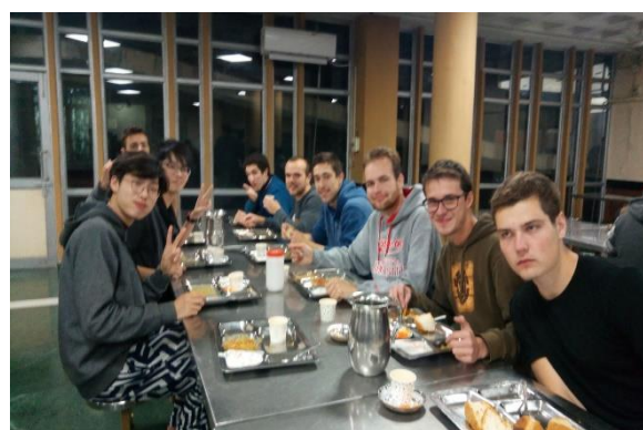
(圖四：宿舍餐廳聚餐，聊聊今天所發生的事情)