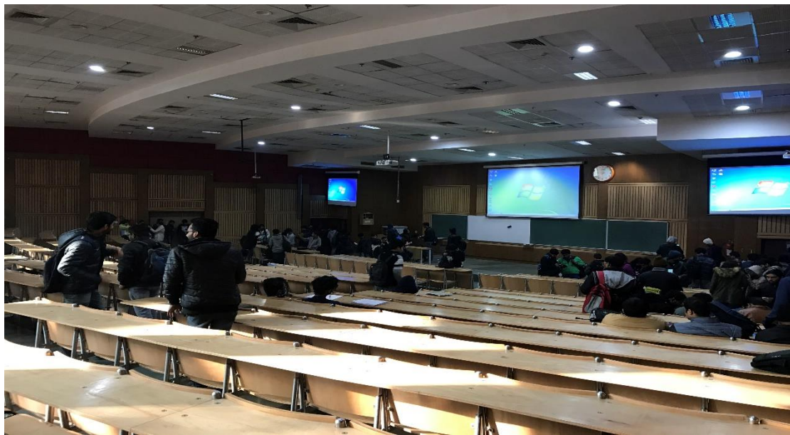
(圖一：IIT Delhi 的課堂大教室)