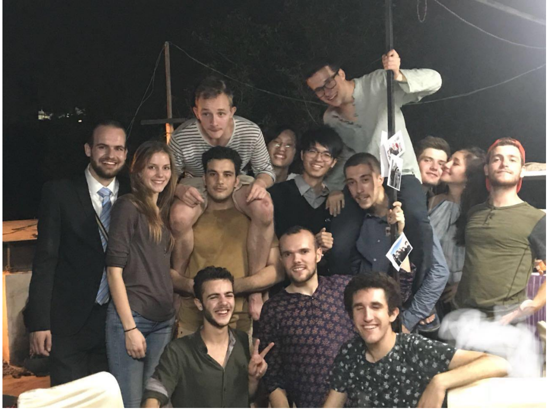
(圖五：與國際學生們在宿舍天台舉辦烤肉活動)