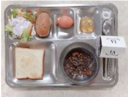
早餐：每天幾乎都差不多

如果有特殊理由的話，可以拿證明跟辦公室申請退費，我後來就拿語學堂的繳費證明退掉了早餐和午餐，因為沒有辦法配合食堂的時間去吃飯，一退就也是整個學期都退費，不行只退其中幾天。