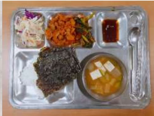
晚餐：每天菜色會有不同變化