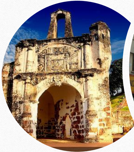
馬六甲 A' Famosa