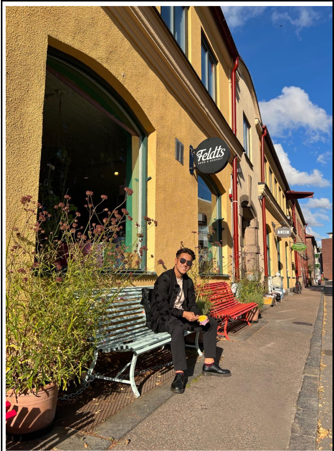
圖 3 說明(20 字) 自己，享受夏天的陽光與生活。