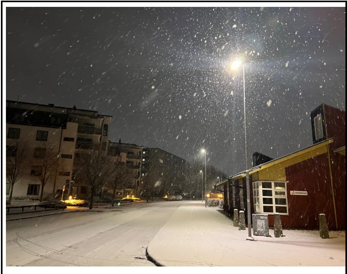
圖 2 說明(20 字) 初雪，猶如電影一般的場景，冰天雪地。