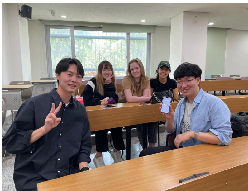
圖 2 說明

與 Business Communication & Writing Skills 小組報告的各國朋友們一起討論與交流。