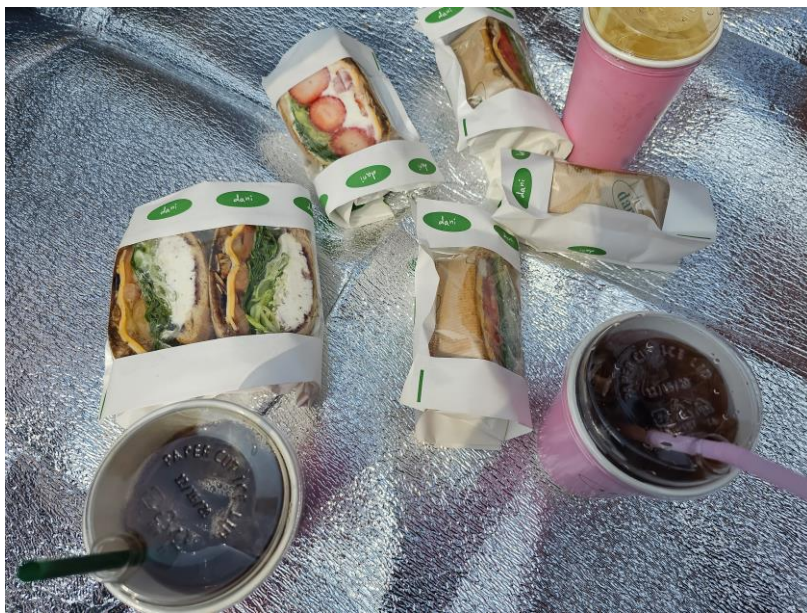
圖 4 說明