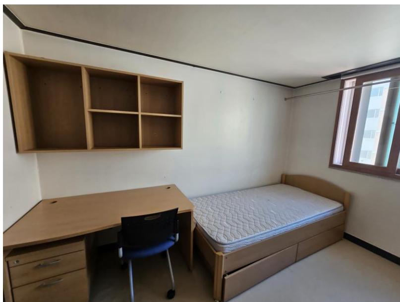
圖 1 說明